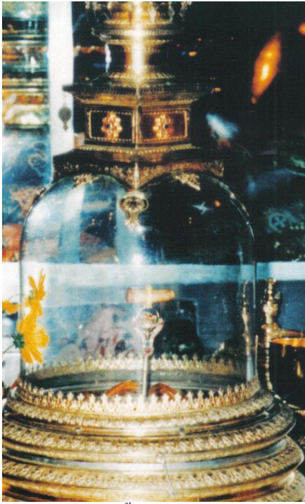
พระหันทธธาตุ : (เขี้ยวแก้ว)ของพระพุทธเจ้า

ขอเชิญจาริกแสวงบุญสู่แดนสิงหล ศรีลังกา พิเศษ ! พิธีงานแห่พระเขี้ยวแก้ว (พระมหาหันทธธาตุ) ต้นพระศรีมหาโพธิ์ กิ่งเดิมจากพุทธคยาที่ตรัสรู้ อุนารูประ มรดกโลก ถ้ำมบลละ ถ้ำลูวิหาร ที่ทำสังคายนา นุวาระเอลิยะ ชมภูเขาไร่ชา น้ำตกลอยฟ้า ھرรษาไปกับทะเลสวยฟ้าใส เพลินใจไปกับธรรมชาติที่บริสุทธิ์