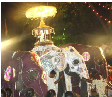
พิธีแห่พระเขี้ยวแก้ว ยิ่งใหญ่อลังการ