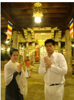
วิหารพระเขี้ยวแก้ว 2554