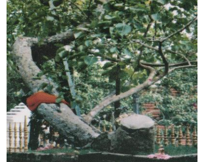
ต้นพระศรีมหาโพธิ์ กิ่งเดิมจากพุทธคยา พระนางสังฆมิตตาเดวีนำผู้ศรีลังกา พ.ศ.236