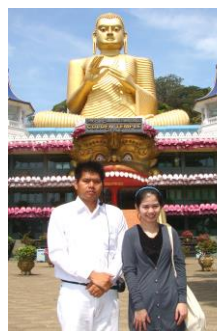
วัดทองคำ : คัมบลละ